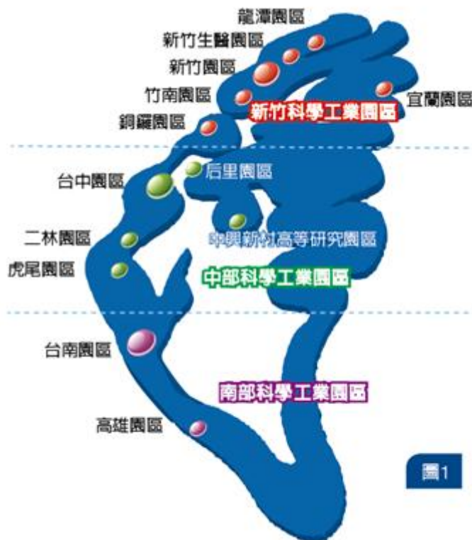
圖1 我國科學園區分布圖

竹科轄屬 6 個園區，分別是新竹、竹南、銅鑼、龍潭、新竹生醫和宜蘭園區，總開發面積 1,342 公頃；中科轄屬台中、虎尾、后里、二林和中興新村高等研究園區，總面積 1,708 公頃；南科轄屬台南和高雄園區，面積 1,613 公頃，這三大科學園區面積共計 4,663 公頃(圖 1)。