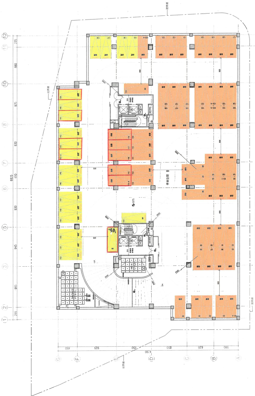
圖 11-D-2 重建區段D 地下三層平面圖 Scale=1/300